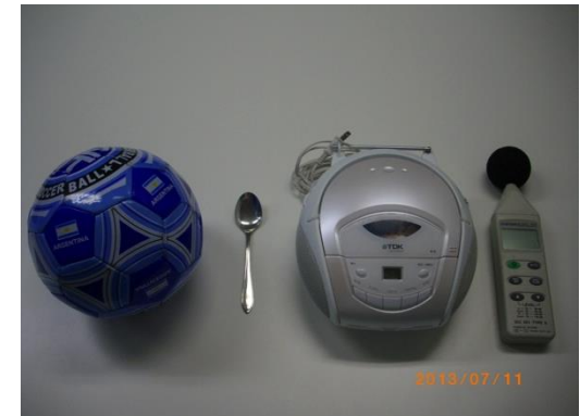
▲検証に使用した道具